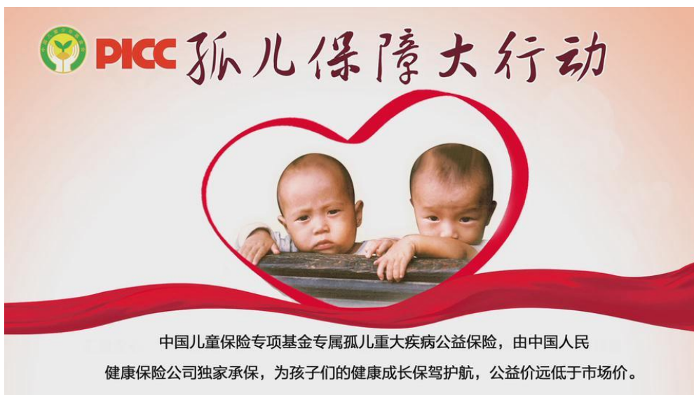
“孤儿保障大行动”公益项目宣传图片

公司广泛开展健康保险和健康知识宣传活动，提升群众的健康意识，普及推广疾病预防知识，倡导健康生活。例如，在新疆乌鲁木齐，连续七年联合当地知名公立医院，举办“关爱健康、走进农牧区”大型义诊宣传活动，结合农牧区特点，向农民宣传新农合补充医疗保险政策和疾病预防、治疗知识；在江苏吴江，联合当地健康教育所、疾病预防控制中心、红十字会等单位，共同举办了“结核病日”广场宣传活动，普及结核病防治知识，帮助市民养成健康的生活方式；在陕西渭南，参加了陕西省妇联等多家单位联合举办的“关注女性健康、关爱贫困母亲”2015“母亲节”健康服务进韩城活动，开展了现场健康检测、健康咨询、健康知识宣传等活动。