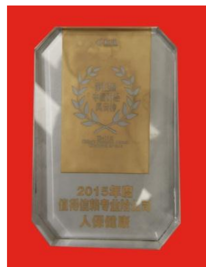
人保健康荣获的“年度最佳专业保险公司”和“2015 年度值得信赖专业险公司”奖项