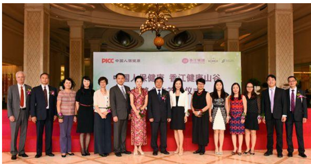
人保健康与香江集团战略合作签约仪式

构、银行总对总业务合作平台，共同开拓市场。修订中介业务管理办法，完善中介业务管理制度和内控体系。注重维护与银行的业务合作关系，通过高层互访、培训支持，加强双方在客户、产品、品牌、渠道等方面的全方位、深层次合作，实现互利共赢。完善合作医疗健康机构管理制度，共建共享医疗健康信息，共同为客户提供更加优质的医疗服务和健康管理服务。与多家健康服务机构建立战略合作关系，共同整合扩展产业资源、推动产品服务创新。