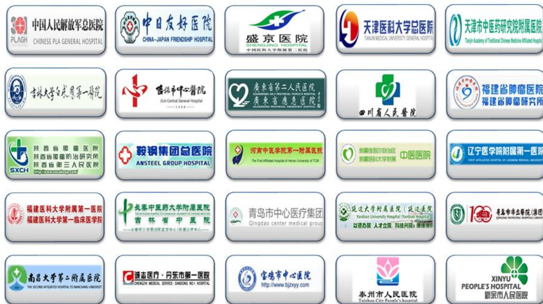
人保健康部分签约医院

公司积极搭建“人民医院+N个定点医院”为依托的服务网络，全系统共签约知名三甲医院 535 家，签约副主任（含）以上专家医师 2084 名，设立了 18 家 VIP 诊疗室（商保室）。探索搭建海外高端医疗服务网络，与欧乐集团、贝勒盛威医疗集团、波士顿儿童医院等机构接洽合作，为客户提供全球救援和境外就医服务通道。积极推进健康档案建设，通过个人健康问卷、健康体检、电子病历等途径，为 455 万余名客户建立了健康档案，覆盖面进一步扩大。依托医疗资源，开展预约挂号、绿色通道等就医服务 1.4 万余人次，为客户提供体检筛查、健康评估等服务 309 万人次，在改善客户健康、控制医疗风险方面发挥了积极作用。