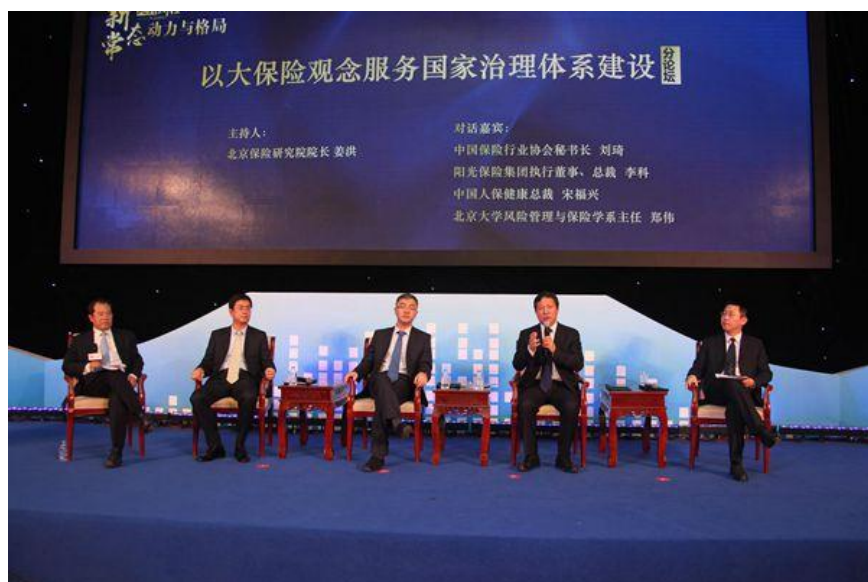
人保健康党委书记、总裁宋福兴应邀出席人民财经年会