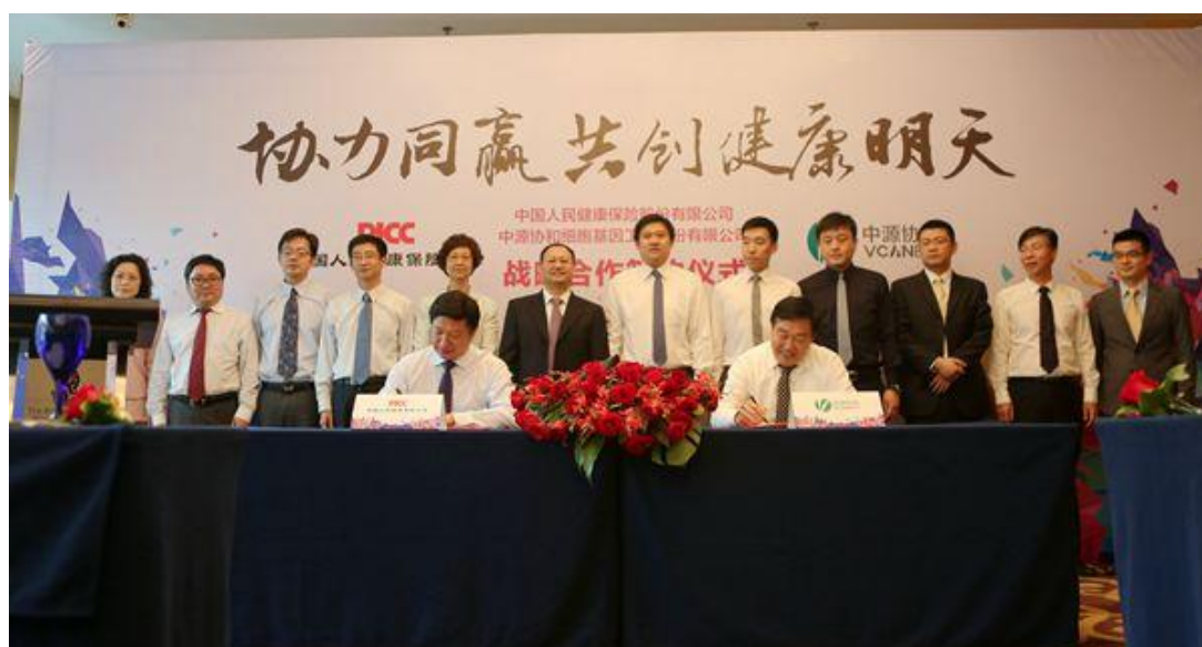
人保健康与中源协和细胞基因工程股份有限公司战略合作签约仪式