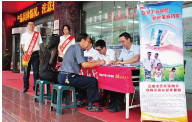
人保健康在多地开展健康保险和健康知识宣传、义诊活动