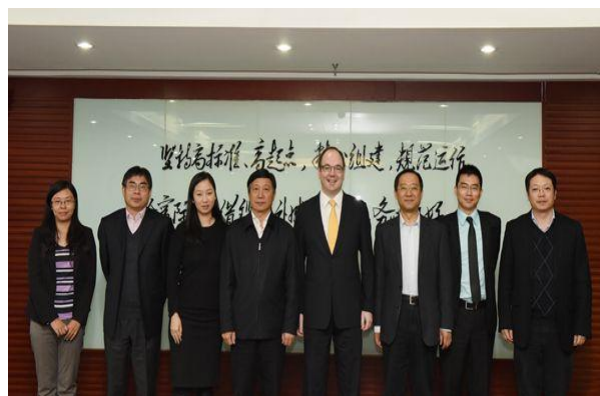
人保健康与美国贝勒盛威医疗集团、慕再健康全球再保险、百慕大博纳再保险、法国再保险等机构会谈