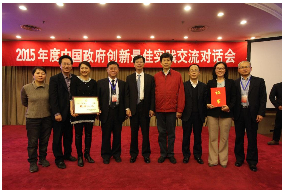
青岛市医疗护理险项目，荣获年度中国政府创新最高奖

公司以服务国家医疗保障体系建设为己任，按照“委托经办、保险保障”相结合的方式，丰富业务形态、创新发展模式、规范经营管理，强化医保经办管理者和医疗服务付费方的角色定位，不断扩大保障覆盖面和市场影响力，在城乡居民大病保险、基本医保经办、护理保险、基本公共卫生服务等方面，致力于为政府和民众提供“保障水平更高、风险管控更强、运营成本更低、服务质量更优”的医保管理解决方案。公司在安徽获得基本医疗保险经办资格，深度参与国家深化医改综合试点。在北京积极介入基本公共卫生服务，中标北京市预防接种异常反应保险项目。在青岛中标医疗护理险项目，该项目荣获年度中国政府创新最高奖——“最佳实践奖”。2015年共承保政府委托业务项目315个，覆盖24个省（自治区、直辖市、计划单列市）的130个地市，服务人群1.44亿人次。