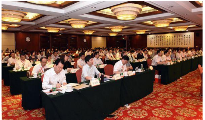
丰富多彩的各类培训活动