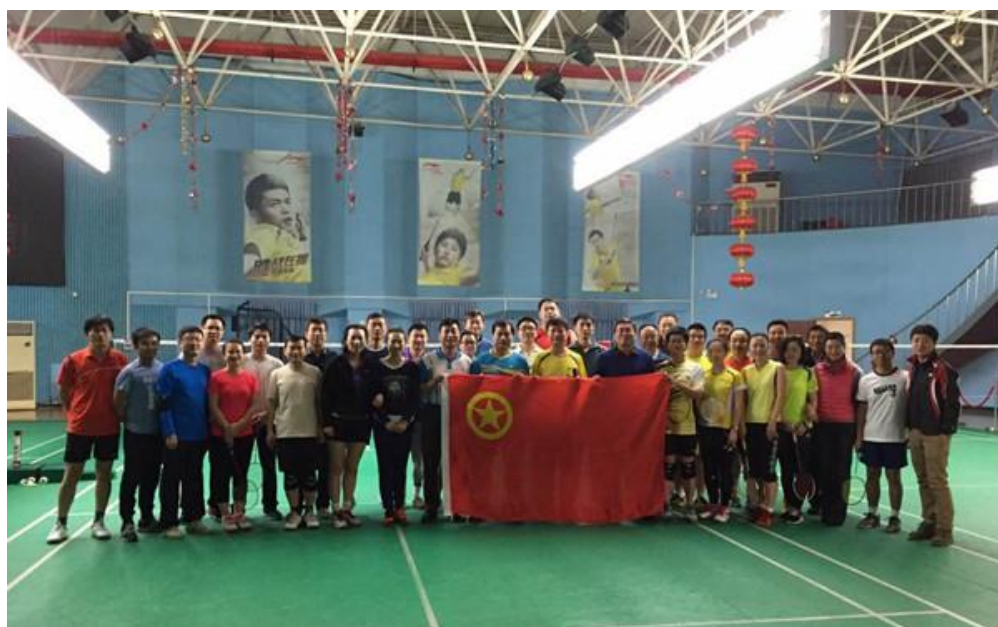
人保健康团委组织的 2015 年“人保健康青年杯”羽毛球友谊赛