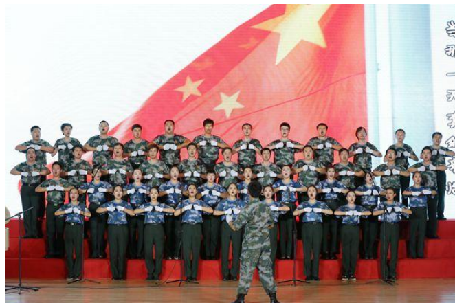
人保健康纪念抗战胜利 70 周年暨庆祝建国 66 周年歌咏比赛